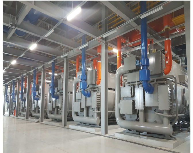
▲ 인천국제공항에 설치된 흡수냉동기

인천국제공항에 납품한 고효율 저온수2단 흡수냉동기 는 여름철 많이 사용되지 않는 지역난방 온수 를 활용해 중앙공조방식 으로 실내 냉방 을 공급합니다.