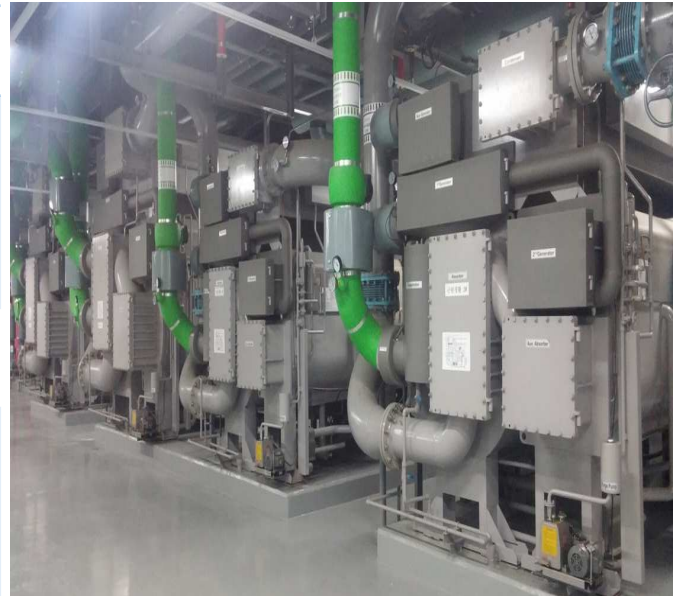
▲ 판교 U SPACE1, 2에 설치된 흡수냉동기

조 건 Chilled Water : 12 / 7 °C Cooling Water : 31 / 36.5 °C Hot water : 95 / 55 °C