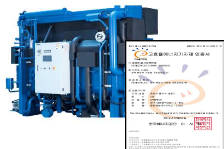
고효율에너지기자재 인증서 ▲